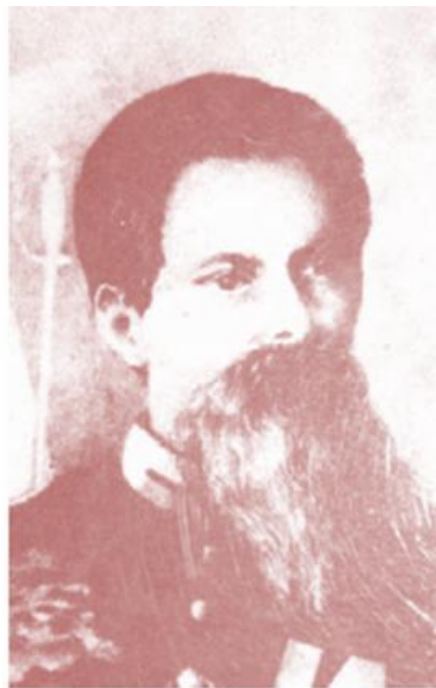
Coronel Manuel Obligado

Fue un destacado participante de la epopeya fronteril que comandaba el entonces Coronel Obligado.