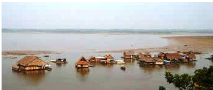
Iquitos – Perú – Web