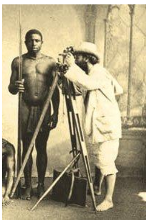
Creveaux probando su instrumental astronómico en África.

Jules Creveaux , el hombre de los pies descalzos, como se lo conocía burlescamente – de padres posaderos – había nacido en Lorquin (Meurthe), Lorena, Francia, el 1° de Abril de 1847 y se educó profesionalmente en el Liceo de la ciudad de Nancy hasta obtener su título de médico en Estrasburgo. Se incorporó en octubre de 1867 a la Escuela de Medicina Naval de Brest. En 1868, fue nombrado asistente de cirugía en el Hospital de Brest y un año más tarde, viajó a Senegal, las Antillas y Guyana antes de volver al hospital de Brest.