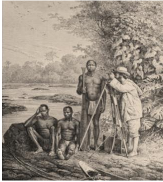
Dibujo de Creveaux con su instrumental en América - Web

En sus repetidos e incansables viajes posteriores, vino por segunda vez a la Argentina en 1881 por cuenta de su gobierno con fines de recorrer los ríos sudamericanos, comenzando por el Pilcomayo; antecedentes que denotan una formación amplia en los aspectos científicos necesarios para moverse con cierta libertad en regiones remotas, particularmente astronómicos, que perfeccionó en el Observatorio de Tolón.