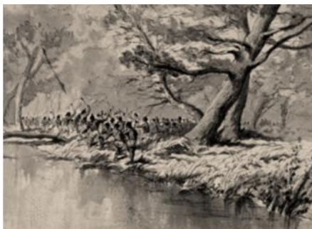
Recreación de la muerte de Creveaux - Web

El 19 de abril de 1882 los tobas asesinaron a Jules Creveaux y once de sus compañeros – entre los que se encontraba el marino argentino Carmelo Blanco y su colega francés Haurat – cerca de La Horqueta en el Pilcomayo.