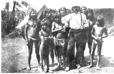
Creveaux con los tobas

El 19 de abril de 1882 los tobas asesinaron a Jules Creveaux y once de sus compañeros – entre los que se encontraba el marino argentino Carmelo Blanco y su colega francés Haurat – cerca de La Horqueta en el Pilcomayo.