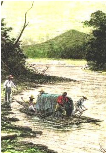
Creveaux en el Orinoco

En sus repetidos e incansables viajes posteriores, vino por segunda vez a la Argentina en 1881 por cuenta de su gobierno con fines de recorrer los ríos sudamericanos, comenzando por el Pilcomayo; antecedentes que denotan una formación amplia en los aspectos científicos necesarios para moverse con cierta libertad en regiones remotas, particularmente astronómicos, que perfeccionó en el Observatorio de Tolón.